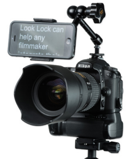
LookLock-Gelenkarm mit iPhone-Halterung