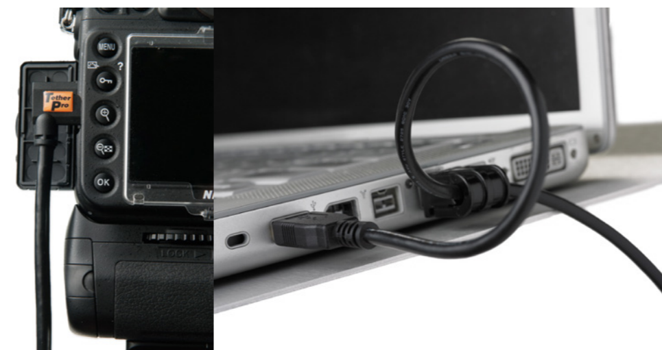
JerkStopper Laptop Kit