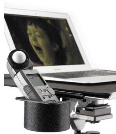
Tether Table Aero-System mit optionalem Becherhalter