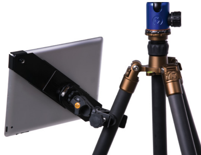
AeroTab Universal-Halterung für Tablets