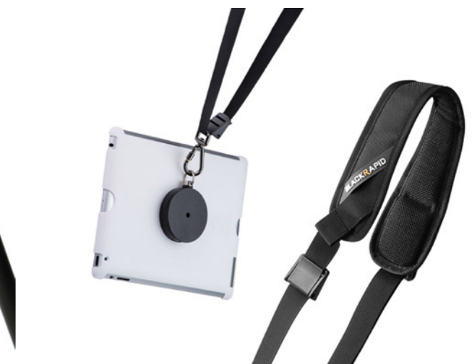
Proper Tab Strap Befestigung mit BlackRapid-Gurt als Tragelösung