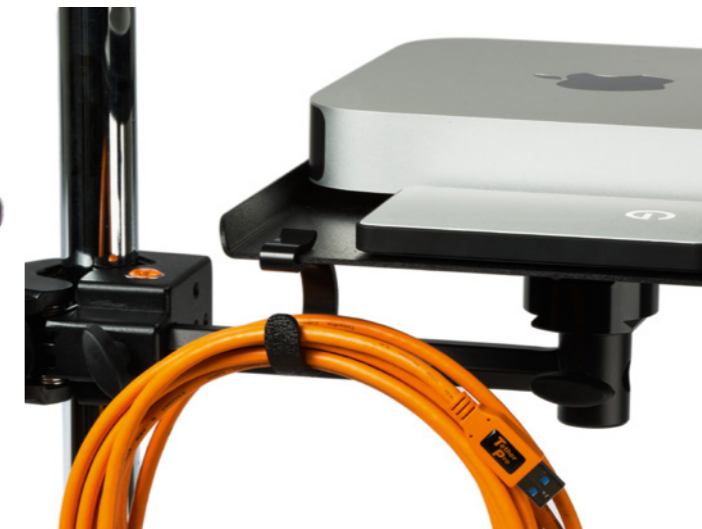
TetherPro Premium-Kabel in Signalfarbe