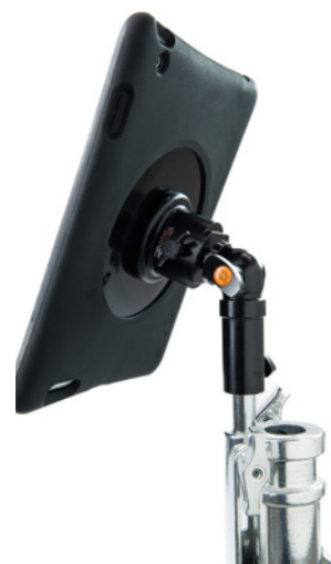
Wallee-Hülle mit Bumper Case Connect Halterung und Aero Ellbow