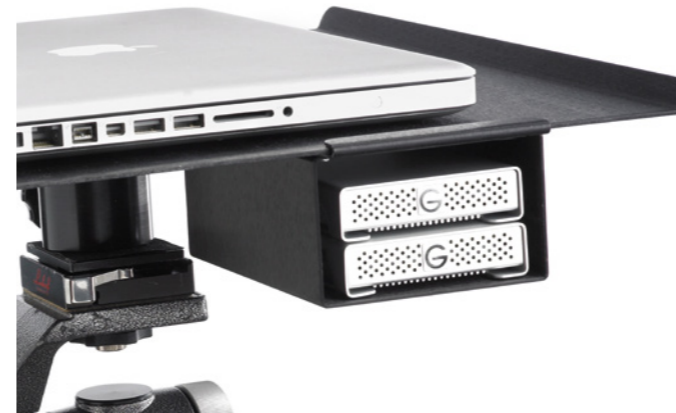
Tether Table Aero-System mit Ablage für externe Festplatten